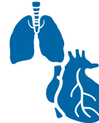
Tapkua uummalluutilgit puvagluutilgillu